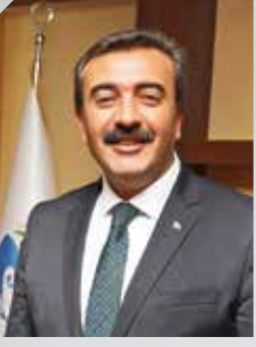
SONER ÇETİN ÇUKUROVA BELEDİYE BAŞKANI