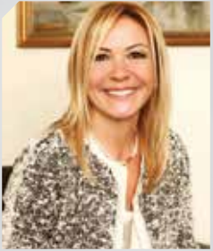
ÜMİT BOYNER BOYNER GRUP YÖNETİM KURULU ÜYESİ (TÜSIAD 14. DÖNEM BAŞKANI)

“Türkiye ekonomisinin, toplumsal hayatının ve kültür dünyasının simge kentlerinden olan Adana’nın öncü iş dünyası örgütü ADSİAD’ın kuruluşunun 25. yılını kutluyorum. Ülkemizde bağımsız, şeffaf ve gönüllülük esasıyla bir araya gelen STK’lar içinde önemli bir yeri olan ADSİAD’ın, Adana’nın geleceğin yükselen kentleri arasında yer alabilmesi için geliştirdiği projeleri takdirle izliyorum. İş dünyası olarak sadece üretim ve yatırımla değil, aynı zamanda sosyal fayda yaratacak farklı girişimlerle de ülkemizin gelişmesine katkıda bulunmak hedefiyle çalışıyoruz. Bu bakış açısıyla Türkiye’nin örnek STK’ları arasında yer alan ADSİAD’ın üyelerinin, tüm Çukurova, Türkiye ve dünya için değer ve fark yaratmaya daha uzun yıllar devam etmesini diliyorum.”